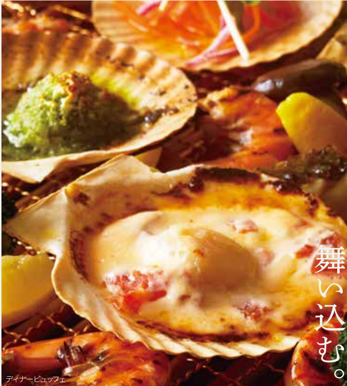
ディナービュッフェ